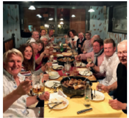
Jeden Abend wurde in den urigen Konobas ordentlich gefeiert.