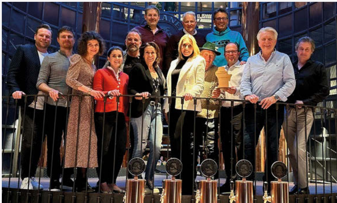
Sensationell war's: der Stammtisch-Auftakt in München