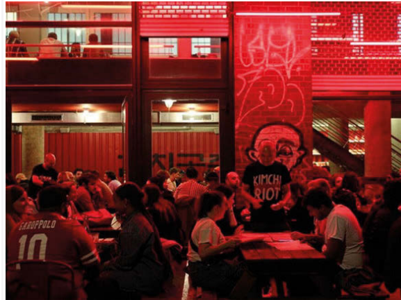
Cooler Koreaner: „Kimchi Princess“